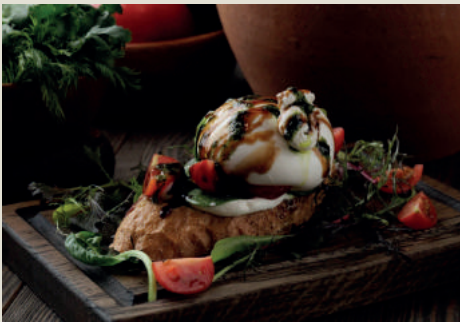
Брускетта с бураттой 300г 690