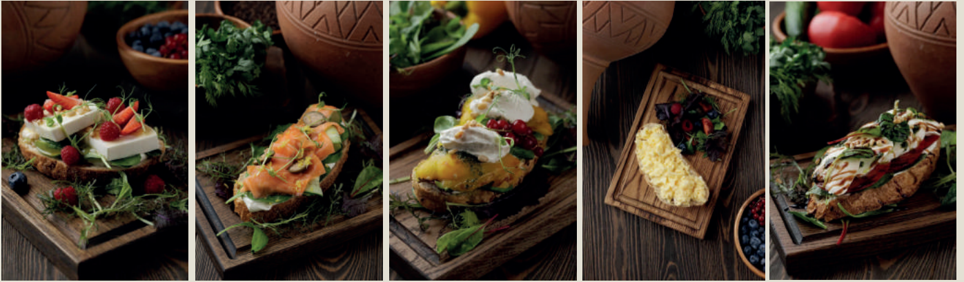
Брускетта с фетой 180г 490 Брускетта с лососем 180г 490 Брускетта с рикоттой 270г 550 Брускетта скрэмбл 270г 390 Брускетта с моцареллой 300г 470