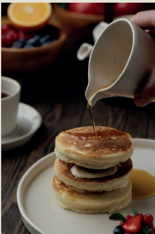
Банановые панкейки с кленовым сиропом