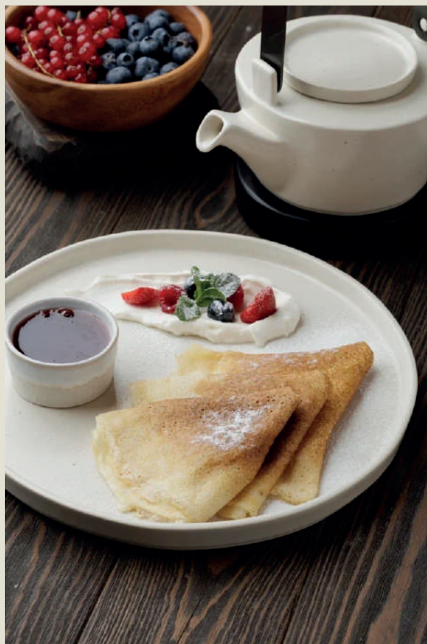
Блинчики со сгущенкой