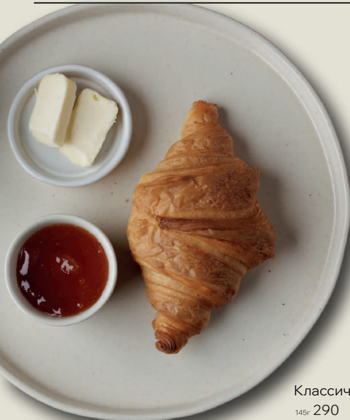
Классический круассан с маслом и джемом на выбор 145г 290