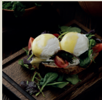
Брускетта Бенедикт 260г 450