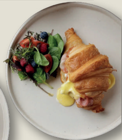
Классический бенедикт с беконом 195г 550