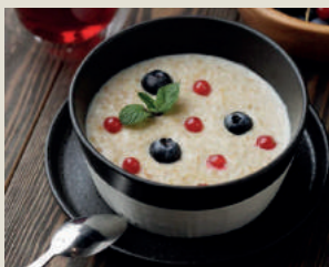
Овсяная каша на молоке или на воде с ягодами 180г 290