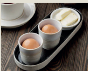
Яйца вкрутую с маслом и тархуном 120г 150