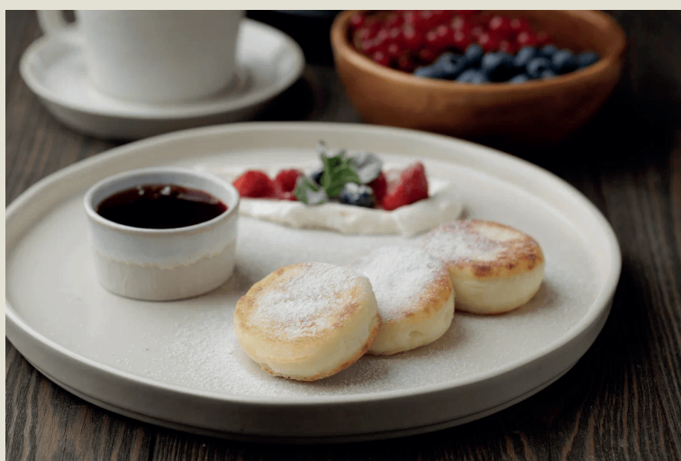
Домашние сырники со сметаной, джемом и ягодами