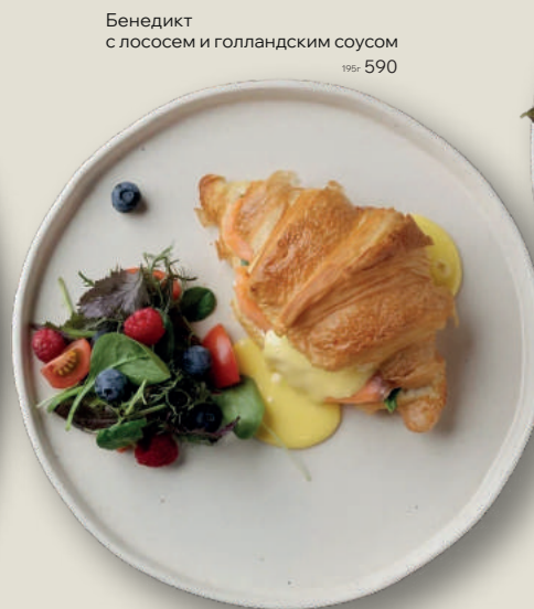
Бенедикт с лососем и голландским соусом 195г 590