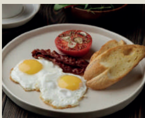
Яичница 220г 290